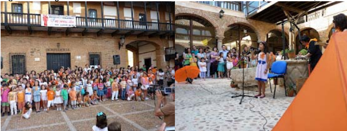
Figura 6. Imágenes del III Encuentro Personas Libro, Educación y Bibliotecas, 2012

En Membrilla ocurrió algo similar, pero además hubo una jornada pedagógica muy fructífera. En 2012 se celebró el tercer encuentro en San Carlos del Valle (Figura 6) con una participación similar, en plena crisis económica, cuando ya no existía el CEP de Valdepeñas debido a los recortes en la educación pública. Pero se pudo demostrar que solo hace falta un lugar agradable y buena voluntad. La pobreza de medios nos importa para esta labor. De hecho, aunque estos encuentros son de un enorme valor para animar a los niños y jóvenes (y a sus familiares) a la lectura, lo más valioso es el día a día, esas narraciones que hacen en los cinco primeros minutos de clase cada día del año, que tienen todavía más valor pedagógico.