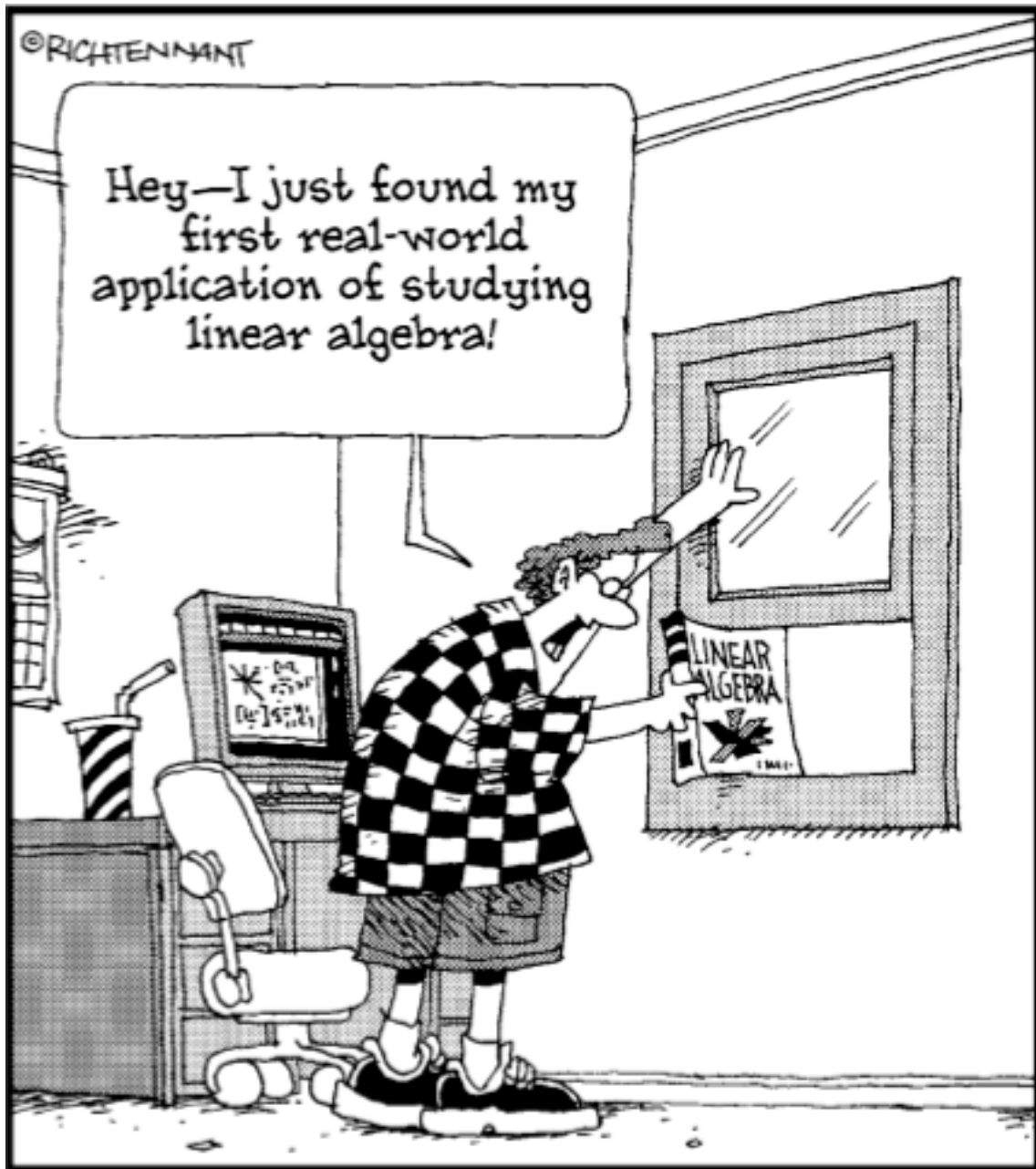
La verdadera utilidad del Álgebra lineal