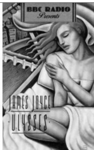
A Arte da Montage e a Modernização: Comentários Sobre Joyce e o Surrealismo.

O objetivo perquirido na arte da montage não é um caos artístico, mas sim fazer dos fragmentos da superfície decomposta as partículas de outra linguagem: fazer a figura provisória de uma realidade aberta .