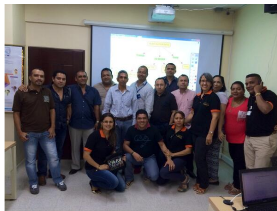
Finalización del curso