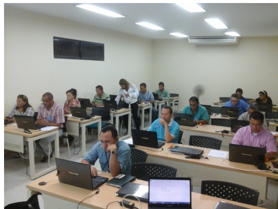
Docentes participantes de Formación en competencias Tic