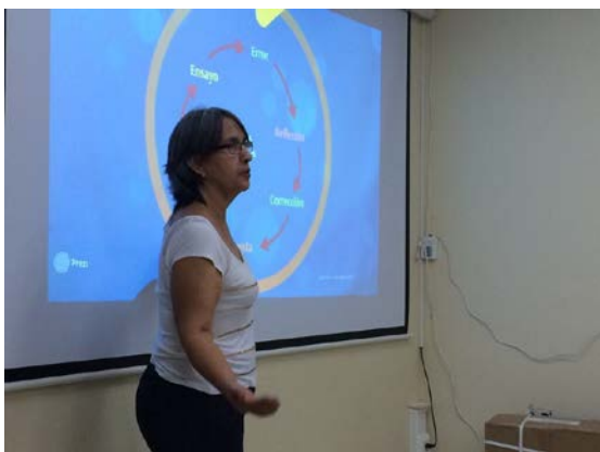
Presentación sobre foros virtuales