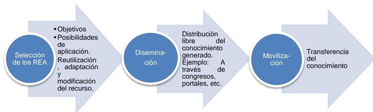
Figura 2. Procesos involucrados en la aplicación de REA

El proceso de la selección de los REA, consideró además los siguientes aspectos relacionadas al dominio y manejo del docente investigador: