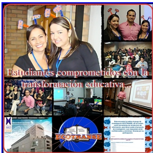
IMAGEN Nº 1