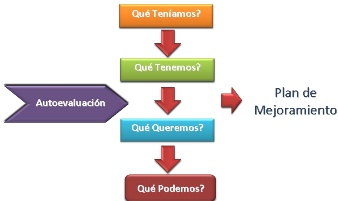
Figura 1. Paradigma institucional de autoevaluación