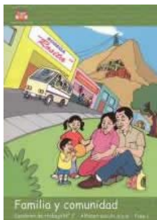
Familia y comunidad