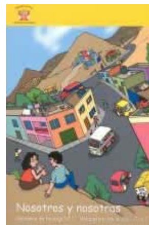
Nosotros y nosotras