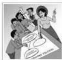
Organización y participación en la comunidad Cuaderno N°3