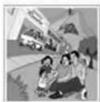
Familia y comunidad Cuaderno N°2